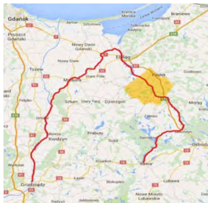
Foto kaartje Noord Polen met de 10 km kanaal met rolbergen

Rolbergen, overtomen: een van de Zeven Wonderen van Polen. Ten noorden van het redelijk vlakke moeras- en merengebied in het midden van Polen, gaan zo'n 10 km van het kanaal door het 'Oberland', het heuvelachtige Hoge Land ten zuiden