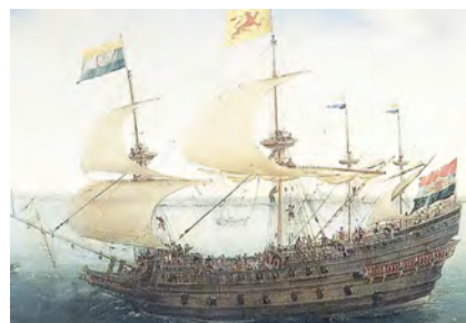
De Vlieghende Groene Draack.