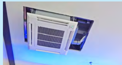
In de soos zijn twee warmte-airco's geïnstalleerd. Tegen het servicegebouw wordt een warmtepomp aangebracht en binnen een bijbehorende boiler.

TrompMagazine 2023 Nr6 verschijnt rond: eind oktober