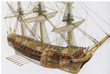
(tekst uit het boek 'Het Monsterschip')

Tromp wilde ook een tweetal lichte fregatten, schepen die hij 'roeijachten' noemde, speciaal voor de blokkade van Duinkerke. Ranke jachten van 28 meter lang en 5,70 meter breed. Vaartuigen die bij windstille konden worden omgetoverd tot galeien met plaats voor tientallen roeiers en dolboorden voor de riemen.