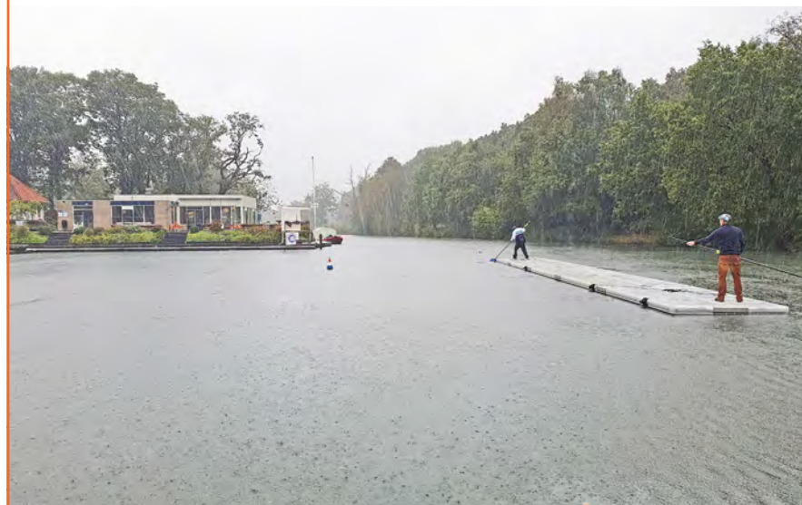
Hagar Walstra en Menno Proper op een mega-sup.