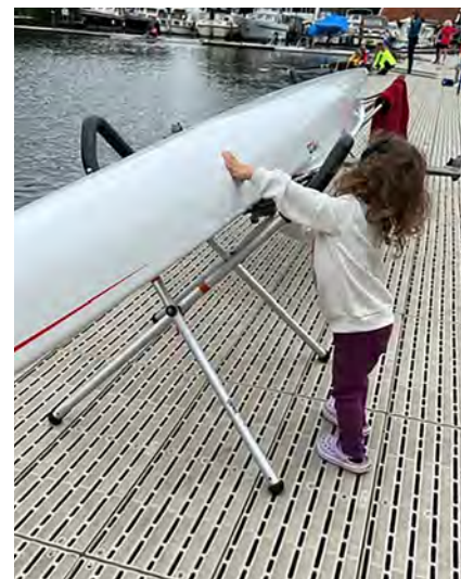
Tijdens de EBTR: jong geleerd ...